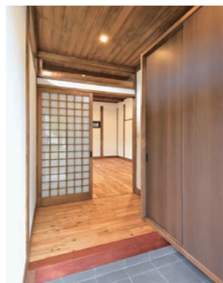
■玄関ホール カリン上り框