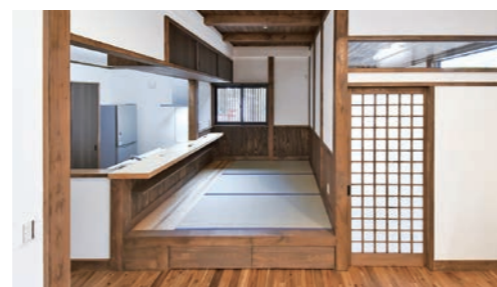
■ダイニング 木曽ヒノキカウンター