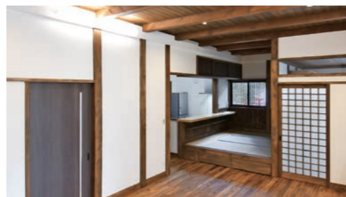
■リビング 真壁造り・化粧梁