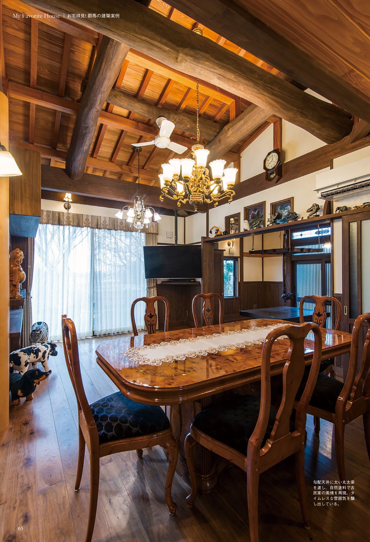
勾配天井に太い丸太梁を渡し、自然塗料で古民家の風情を再現。タイムレスな雰囲気を出している。