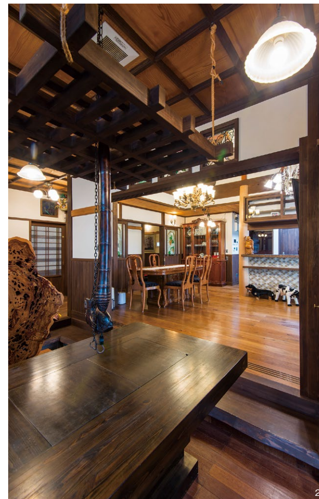
1. 格調高い格天井を採用した広い玄関土間は、ほの暗く落ち着いた雰囲気。大きな屋久杉の衝立が来客を出迎える。 2. リビングと続き間の土間空間に設置された風情ある囲炉裏。「家族や友人との場所でよく食事をします」(ご主人)。 3. 「子どもが遊べるように」(ご主人)、動線に沿って長いうんていを天井に造作。階段は扉を開けると現れる。 4. センターコートに吹き抜けを囲う漆喰壁。その上に瓦を載せ、屋外のようなギミックを利かせた。 5. 竹垣が連続する長いアプローチのある外観。京町家をイメージしたというレトロな佇まい。 6. ロイヤルブルーのタイルがカウンターを彩るトイレ。床には天然石を敷き、アンティーク照明が網代天井を照らす。